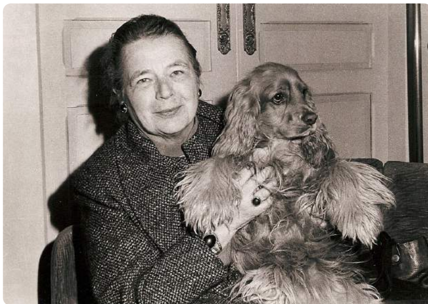
M. Yourcenar_© Petite Plaisance Trust Tous droits réservés

La galerie de reproductions photographiques en grand format, dès l'entrée, la montre à différentes périodes de sa vie : petite fille comme femme âgée, seule ou avec des proches, dans son intimité comme dans sa vie publique. Elle devient presque présente physiquement, au milieu des visiteurs.