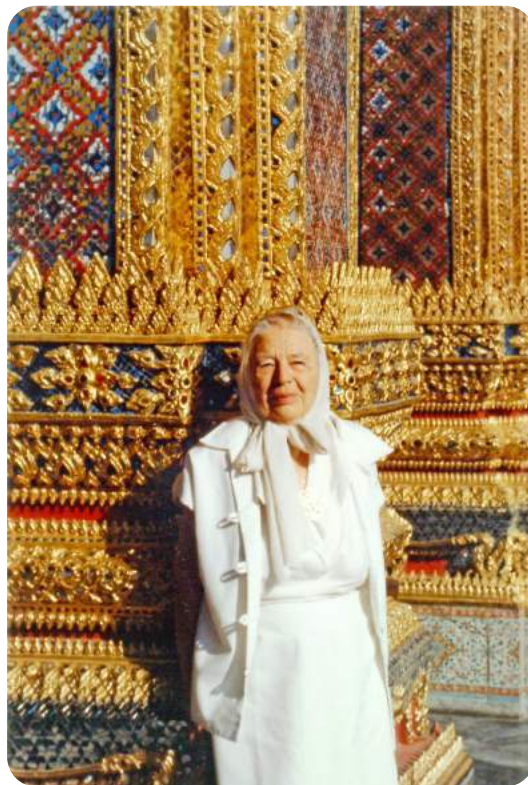
M. Yourcenar_© Petite Plaisance Trust Tous droits réservés

De San Francisco jusqu'au Japon qu'elle aimait tant, Marguerite Yourcenar a, toute sa vie, cherché à s'instruire du monde. Nous vous proposons de la suivre dans les récits riches et sensibles qu'elle a tirés de ses nombreux voyages.