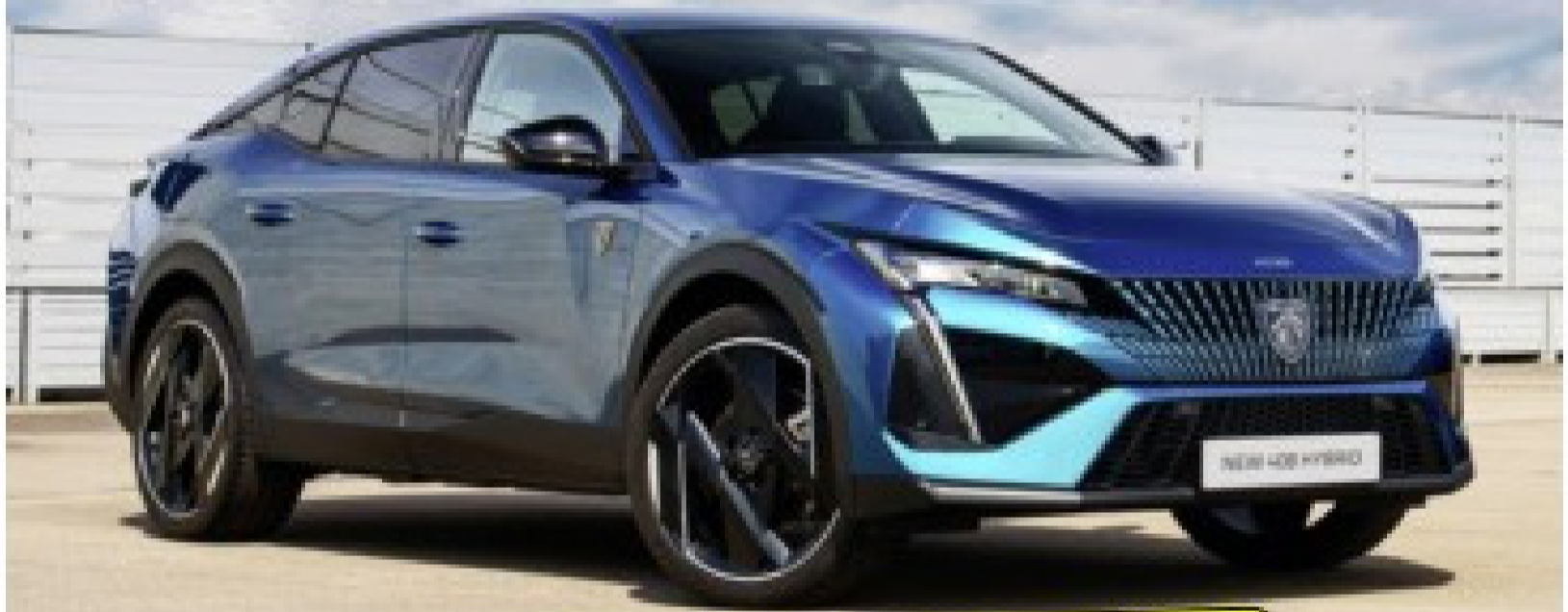
Première confrontation du "cross-coupé" avec les Citroën C4 X et Renault Arkana